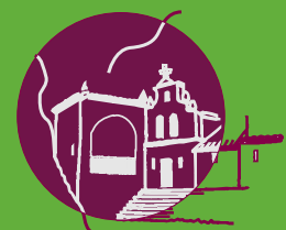
monumento natural Ojo Guareña

Usos: se han empleado con frecuencia en la formación de setos, por su espesura. Los endrinos son usados en la elaboración del pacharán, también llamado “licor de andrines”.